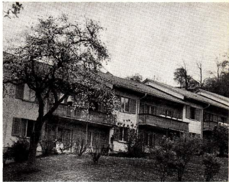
Baugenossenschaft Neuzeitliches Wohnen «In den Birnbäumen» St. Gallen

neuartige Isolation wirkt sich auch günstig auf den Heizmaterialverbrauch aus.